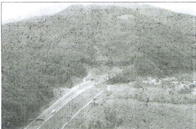
Čez Trojane brez zastojev mimo tunelov