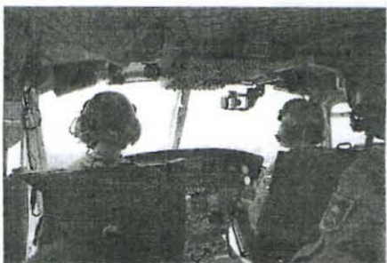
Posadko helikopterja sestavljajo pilot, kopilot in tehnik letalec.

Danes bo spremenljivo do pretežno oblačno. Občasno bodo spet krajevne padavine, deloma plohe in nevihte. Na Primorskem bo pihala zmerna burja. Najnižje jutranje temperature bodo od 12 do 17, najvišje dnevne od 16 do 21, na Primorskem okoli 24 stopinj C.