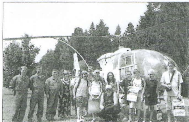
Pa še gasilski posnetek pri Gazelli SA 341, ki je bil prvi helikopter Slovenske vojske.