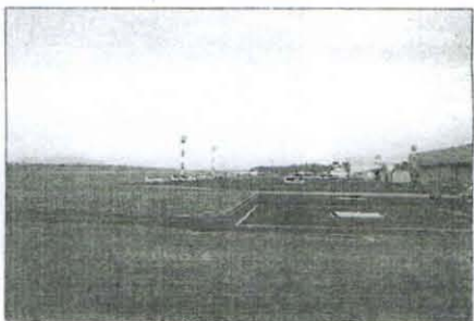
Tik pred pristankom na vojaškem delu letališča Brnik

ki je danes razstavljen na brniškem letališču. V bataljonu je danes 12 helikopterjev, osem B 412 in štirje Eurocopterjevi večnamenski transportni helikopterji AS 532 AL cougar, ki so prispeli v Slovenijo aprila 2003 in marca 2004. Bataljon opravlja tako vojaške kot civilne naloge, saj zagotavlja zračno podporo enotam Slovenske vojske, usposablja pilote in tehnično osebje, sodeluje v iskanju in reševanju ter sodeluje v sistemu zaščite, reševanja in pomoči, izvaja naloge vojaškega letalstva v povezavi z enotami SV in zanje izvaja mednarodne obveznosti, gasi požare in opravlja prevoze tovora v hribovite predele. Skratka bataljon ob zagotavljanju zračne podpore enotam Slovenske vojske opravlja naloge zaščite, reševanja in pomoči na težko dostopnih terenih ob naravnih in drugih nesrečah.